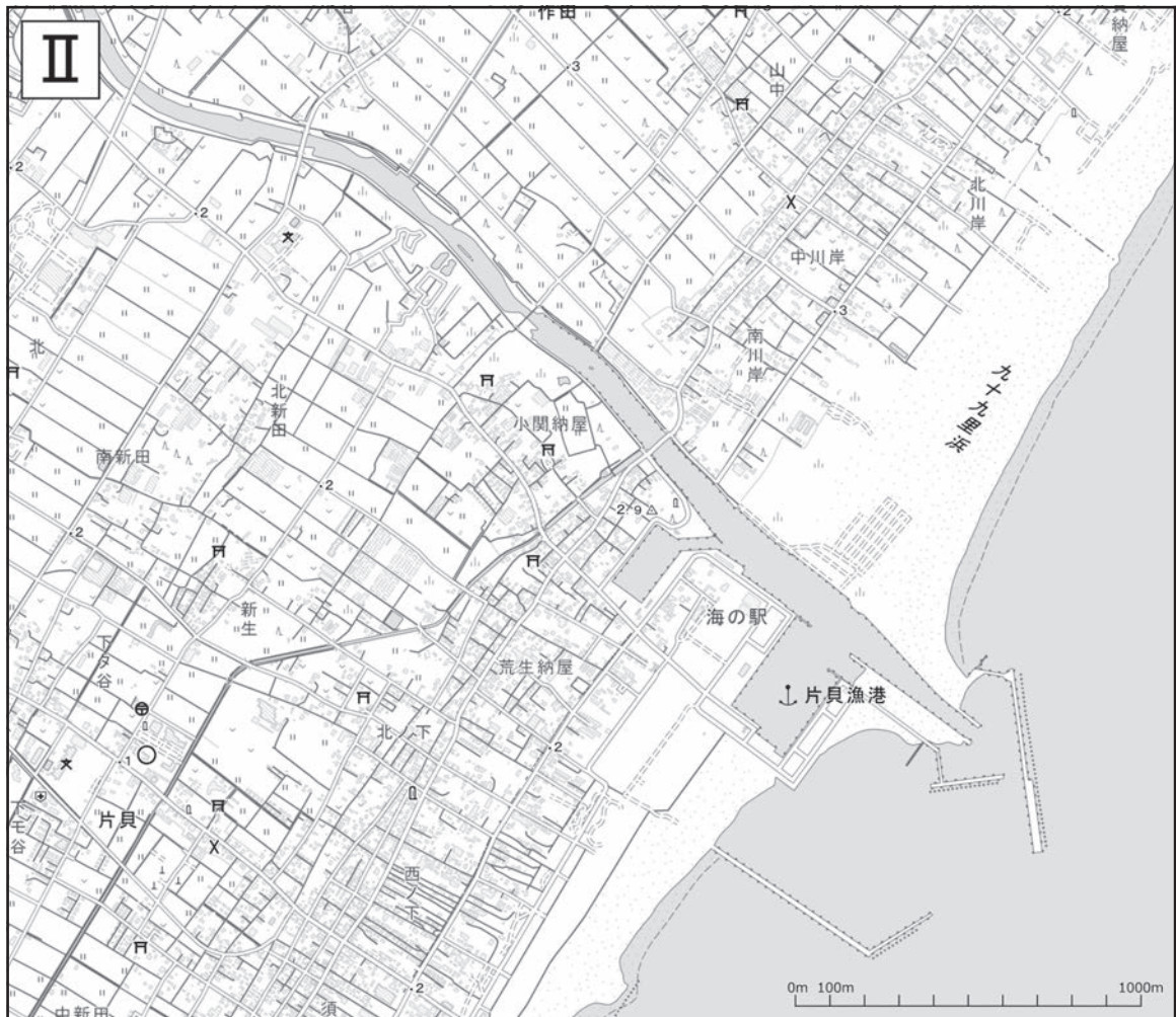
〔地理院地図より作製〕

(9) (8)のⅠ・Ⅱの地図について説明した文として誤っているものを、次のア～エより1つ選び記号で答えなさい。